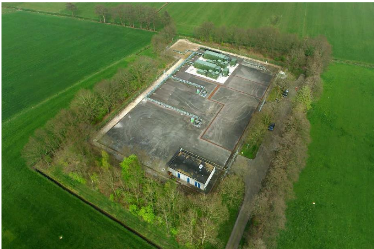
Figuur 2. Voorbeeld van een waterinjectielocatie met waterinjectieskids

De installaties voor verwerking van aardgas zullen worden afgevoerd. De putten worden daar waar noodzakelijk aangepast. Op de locaties worden per injectieput water injectieskids met aansluitleidingen geplaatst. Hiervoor worden de bestaande injectieskids van de reeds beëindigde waterinjectielocaties uit Twente verplaatst naar de nieuwe injectielocatie. Figuur 2 geeft een impressie van Oosterhesselen-2 locatie met water injectieskids. Een water injectieskid bestaat uit een pompskid met elektrische aandrijving. De injectiepompen hebben geluidsomkasting. De leidingen op de locatie en aansluiting op de putten worden nieuw aangelegd en van corrosie bestendigheid materiaal gemaakt (bijvoorbeeld GRE of duplex) om gebruik van biocide te minimaliseren. De putten vereisen nog wel injectie van anti-corrosievloeistof om de integriteit van de putten te garanderen.