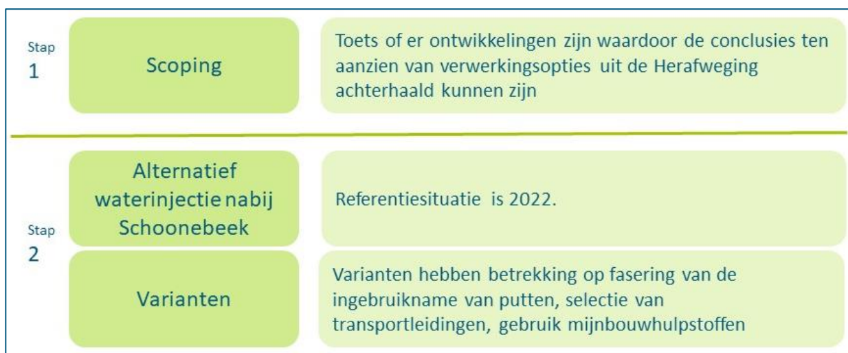
Figuur 3. Opzet van het onderzoek in twee fasen

Vooralsnog wordt er van uitgegaan dat de tweede stap zich geheel richt op waterinjectie nabij Schoonebeek. Indien de uitkomsten van de scoping stap daar aanleiding toe geven, zullen alternatieven worden toegevoegd in de tweede stap.