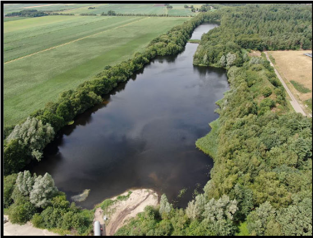
Dronefoto 1: Toepassingslocatie schippersplas.