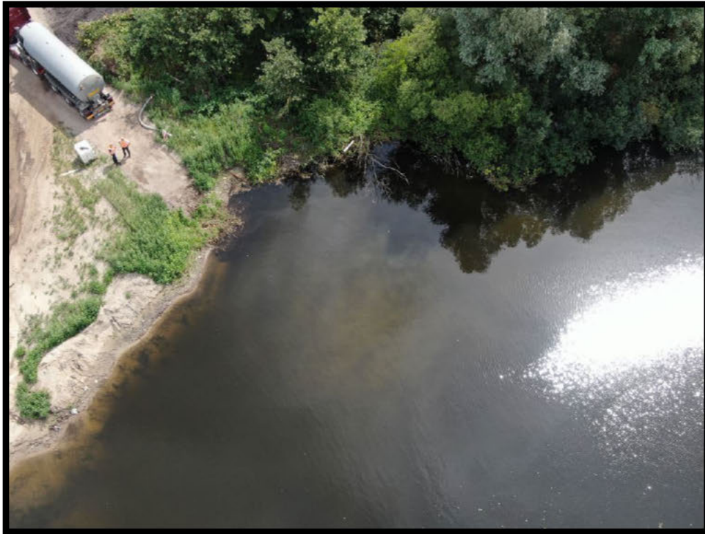
Dronefoto 3: Direct na lossen bezinkt ook de visuele verontreiniging vanwege soortelijk gewicht.