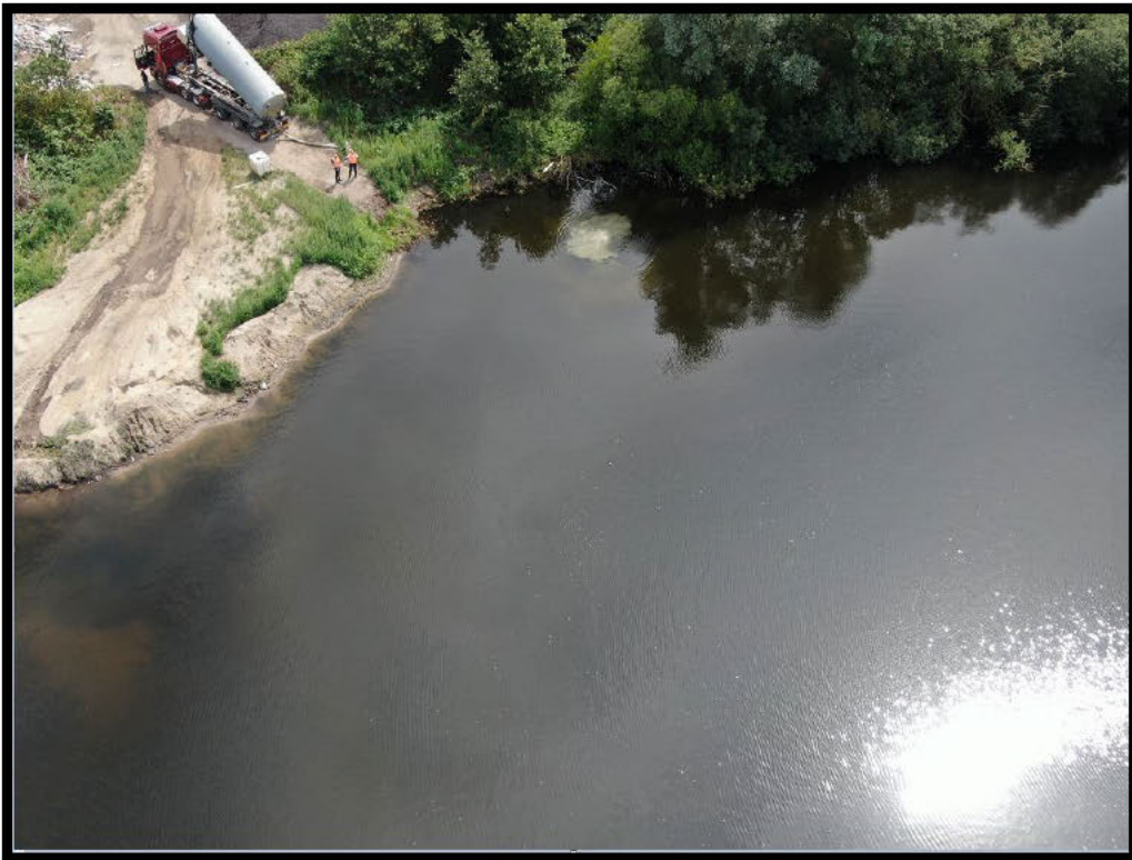
Dronefoto 2: Lichtelijke visuele verontreiniging zichtbaar tijdens lossen.