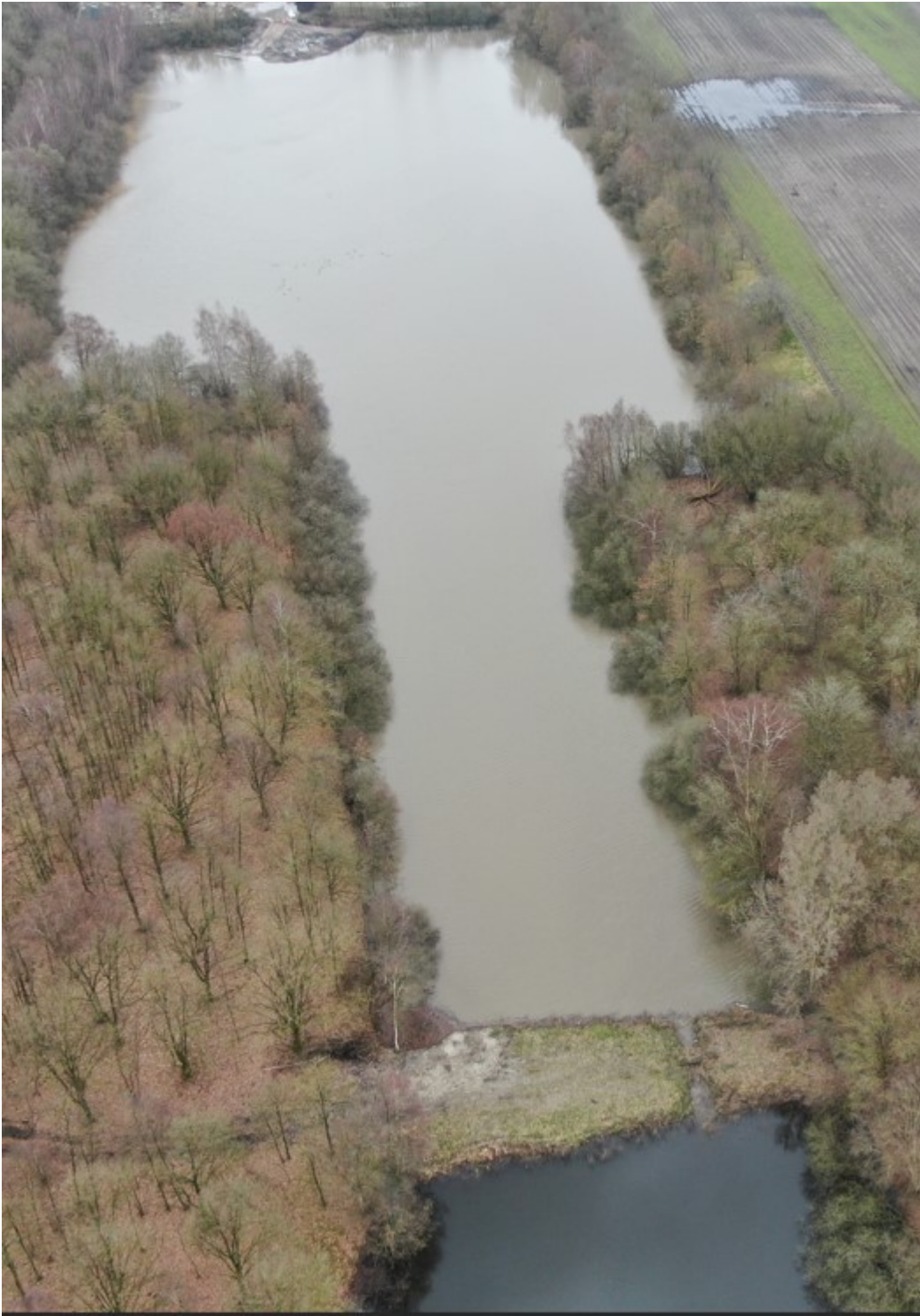
Drone foto Schippersplas 11-07-2023