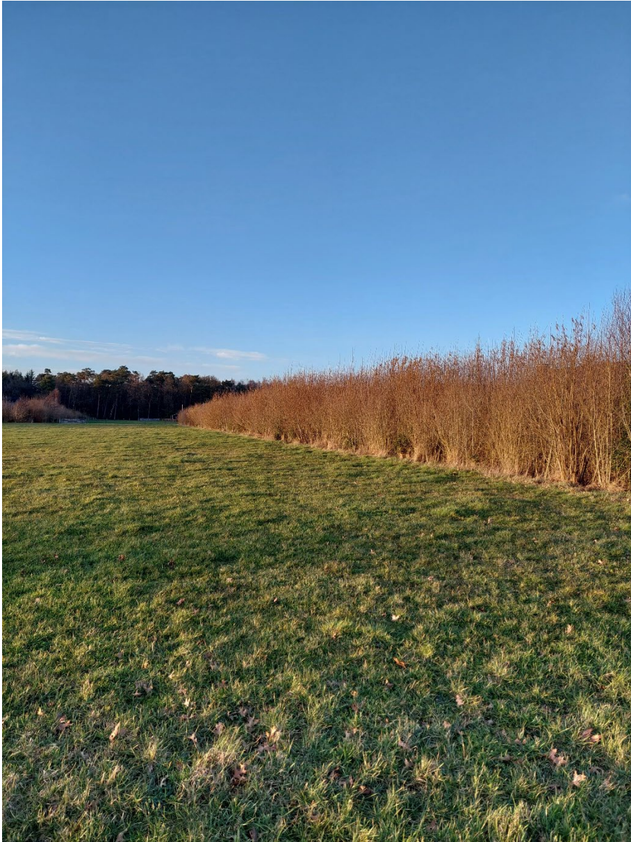
Afbeelding 5: houtopstand oostelijk van het plangebied. Situatie op 13 maart 2023.