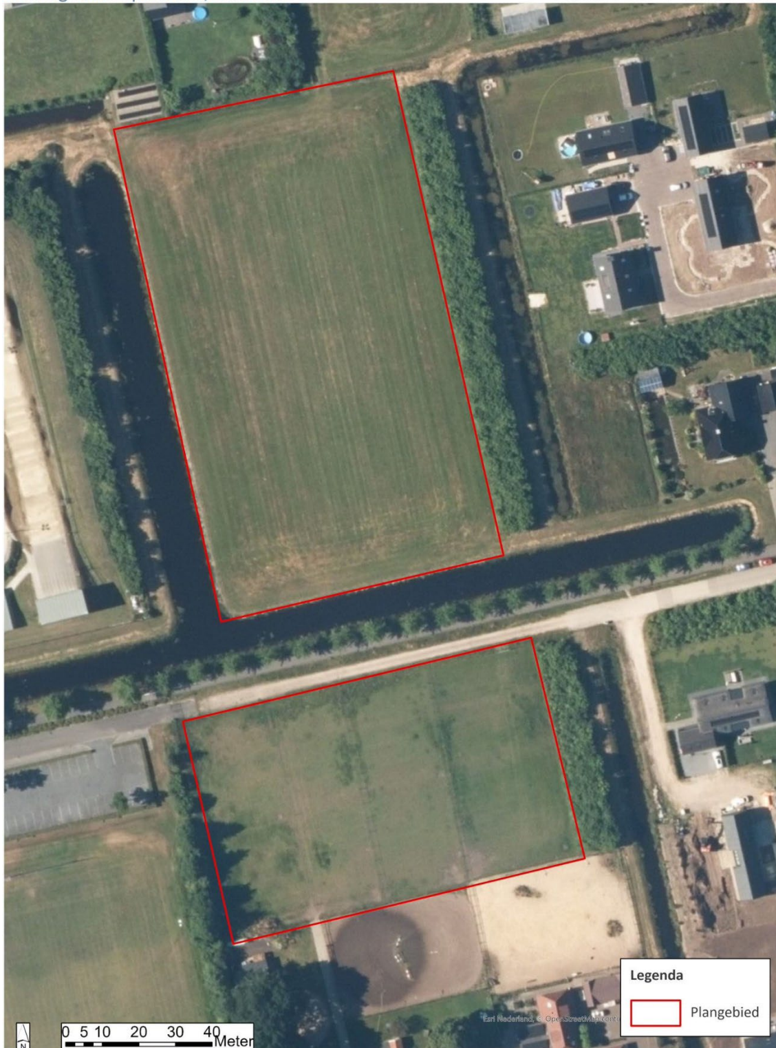
Afbeelding 2: luchtfoto van het plangebied (ESRI, 2023).