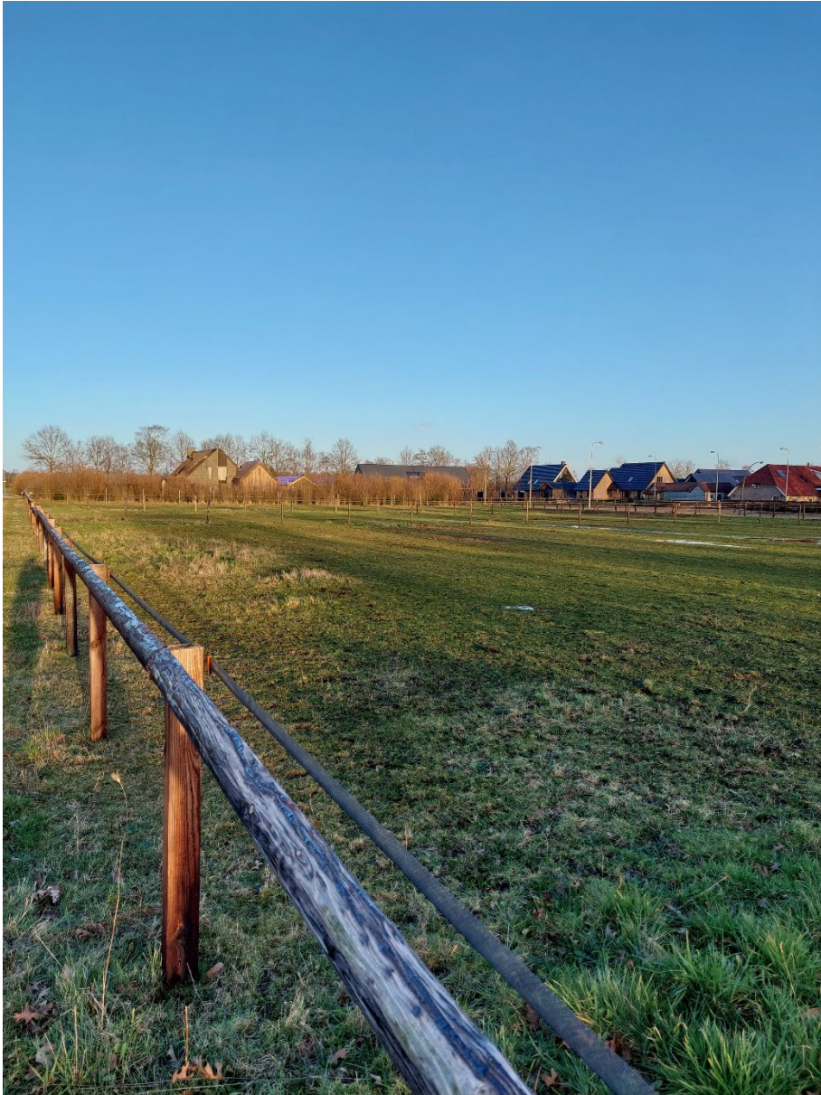
Afbeelding 3: het zuidelijke deelgebied. Situatie op 13 maart 2023.