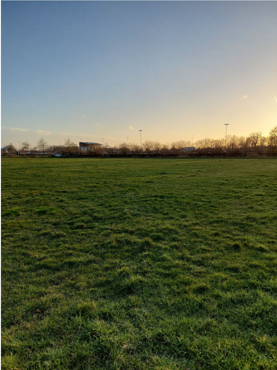
Afbeelding 4: het noordelijke deelgebied. Situatie op 13 maart 2023.