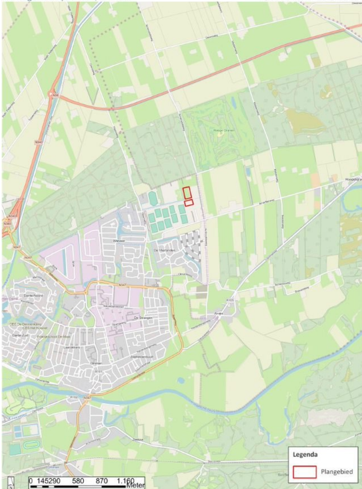
Afbeelding 1: weergave van de ligging van het plangebied (ESRI, 2023).