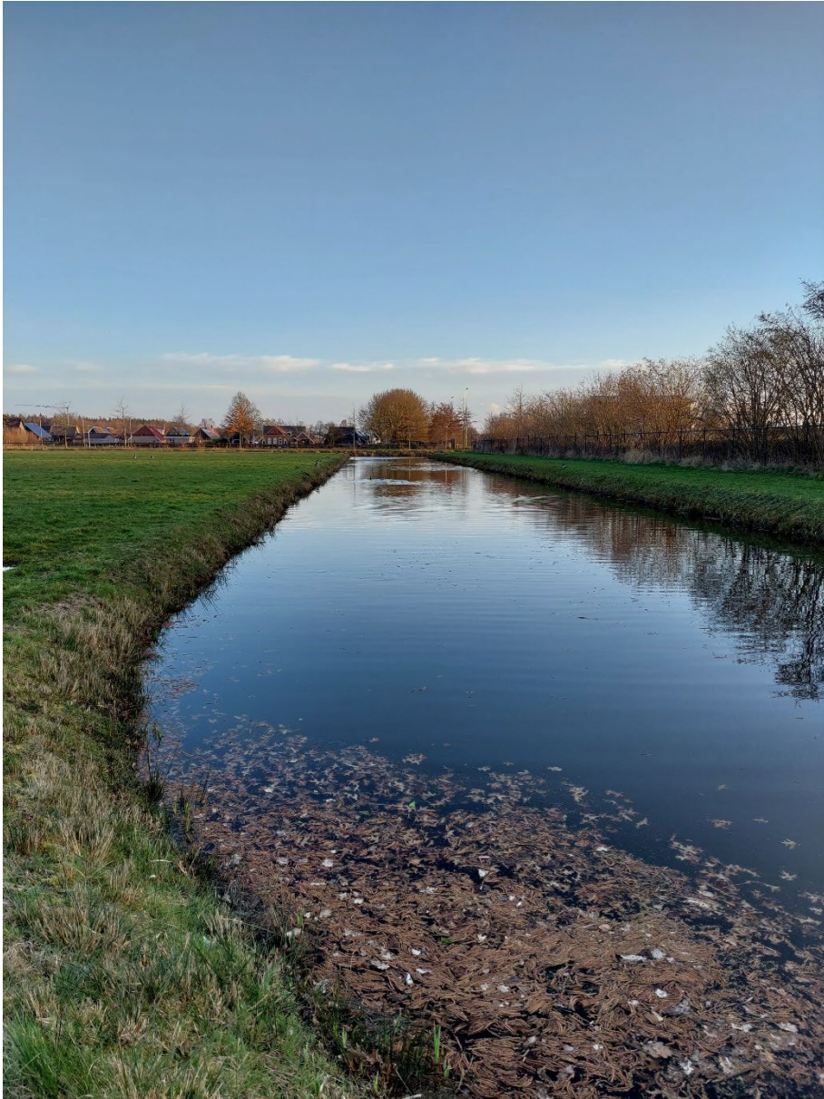
Afbeelding 6: de sloot. Situatie op 13 maart 2023.