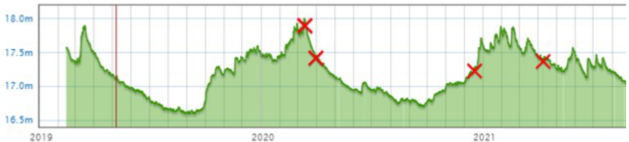
Figuur 2 – Grondwaterpeil t.o.v. NAP- Robijnstraat 6- Twents waternet

laatste meting van bijna 20 jaar geleden. Het Twents waternet beschikt over recente peilbuismetingen ( https://grondwater.webscada.nl/twentswaternet/ ) Volgens peilbuis nummer 1.006, zuidoostelijk gelegen van de projectlocatie, Gedurende de laatste 4 jaar (1-1-2019 tot 26-4-2022) is het gemiddelde van GLG 16,73 m+NAP en het gemiddelde van GHG is 18,01 m+NAP. Vanwege de discrepantie tussen de GLG- en GHG-waarden in het geohydrologische rapport, kunnen we de nauwkeurigheid van de gegevens niet vertrouwen.